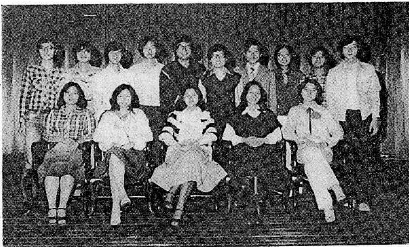
全體工作人員合照