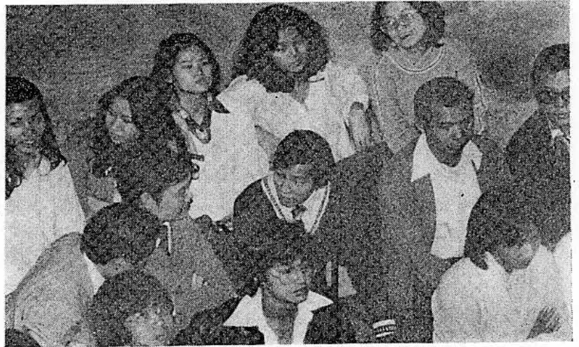
新舊老師聚首一堂